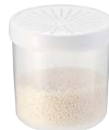
専用カートリッジ